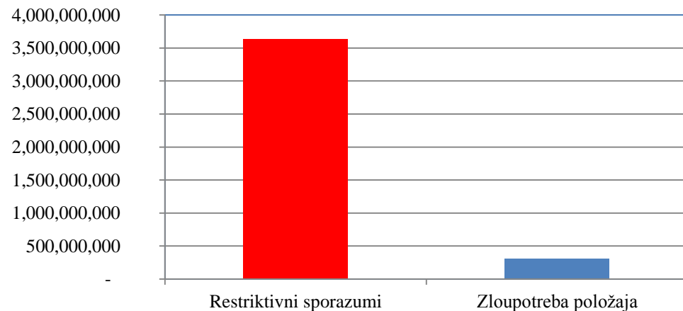
Iznos kazne prema vrsti prekršaja